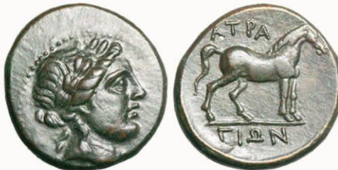
Αρχαίο νόμισμα του Άτραγα

Αλλά η ιστορία δεν γράφεται μόνο σύμφωνα με τη γνώμη που είχαν οι άνθρωποι μιας εποχής για τον εαυτό τους, γι αυτό θα προσπαθήσω να δω πως ο πολιτισμός μας σήμερα αντιλαμβάνεται το παρελθόν του.