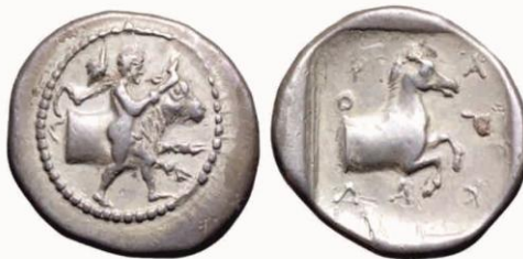
Αρχαίο νόμισμα της Φαρκαδόνας