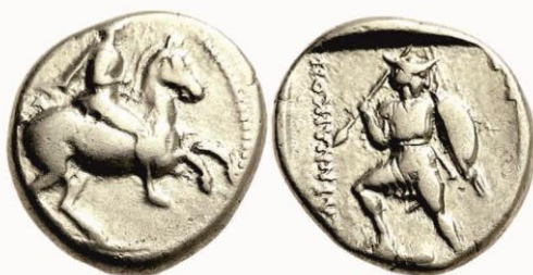
Αρχαίο νόμισμα της Πέλινας

Στην περιοχή Ρουμάνια , μεταξύ Φαρκαδόνας και Κεραμιδίου , σώζεται ένα μικρό μέρος αρχέγονου δάσους αιώνων, το οποίο αναπτύχθηκε και εξελίχθηκε με ελάχιστη ή καθόλου ανθρώπινη επέμβαση. Το δάσος αυτό αποτελεί σπάνια κληρονομιά και ευθύνη μας διότι συμβάλλει στη σταθεροποίηση του κλίματος αποθηκεύοντας τεράστιες ποσότητες διοξειδίου του άνθρακα που, υπό άλλες συνθήκες, θα επιδείνωνε τις κλιματικές αλλαγές. Πρόκειται για ένα από τα τελευταία πεδινά παρθένα δάση όπου οι βιολογικοί κύκλοι δημιουργίας - απώλειας της ζωής, οι αλληλεπιδράσεις των ειδών και οι φυσικές λειτουργίες του οικοσυστήματος υφίστανται αναλλοίωτες στο πέρασμα εκατομμυρίων ετών, σημείο αναφοράς για τους επιστήμονες .