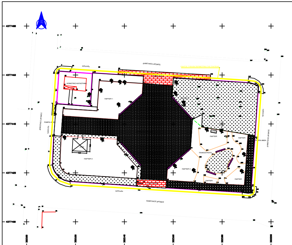
ΑΤΟΣΤΑΣΙΑ ΧΑΡΤΗ ΔΙΑΝΟΜΗΣ ΟΙΚΟΠΕΔΩΝ ΣΥΝΟΙΚΙΣΜΟΥ ΝΟΜΗΣ ΤΟΥ 1932