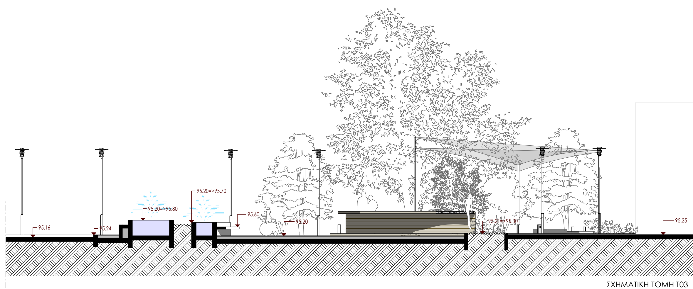
ΣΧΗΜΑΤΙΚΗ ΤΟΜΗ T03